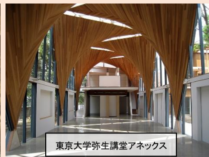
東京大学弥生講堂アネックス