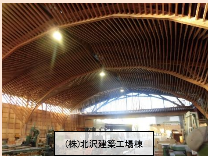
(株)北沢建築工場棟

2002 日本建築学会賞(技術)、松井源吾賞、2006 杉山英男賞、2009 JSCA 賞、2013 日本建築士連合会優秀賞、2014 日本建築仕上学会賞(作品賞・建築部門)、2016 BCS 賞、2019 日本建築学会教育賞(教育貢献)