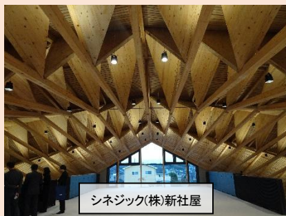
シネジック(株)新社屋