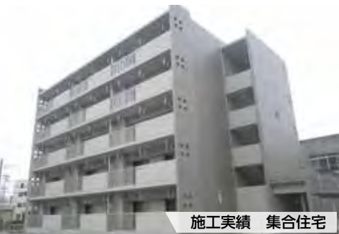
施工実績 集合住宅