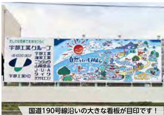
国道190号線沿いの大きな看板が目印です！