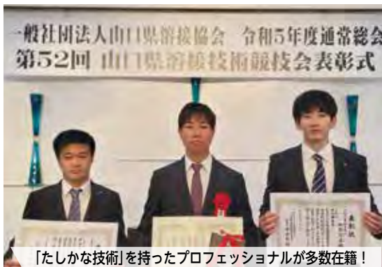
「たしかな技術」を持ったプロフェSSIONALが多数在籍！